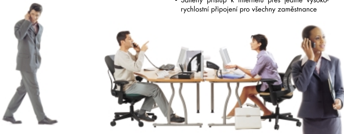
HLAS+INTERNET+DATA "All-in-One" řešení